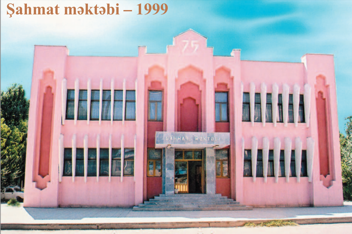
Şahmat məktəbi – 1999